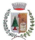
Comune di Ronzone